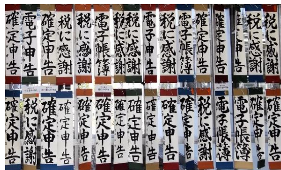
松戸市役所展示作品