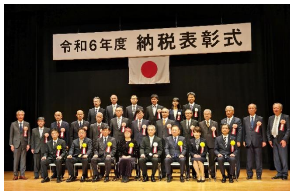
松戸税務署長表彰受賞の皆様