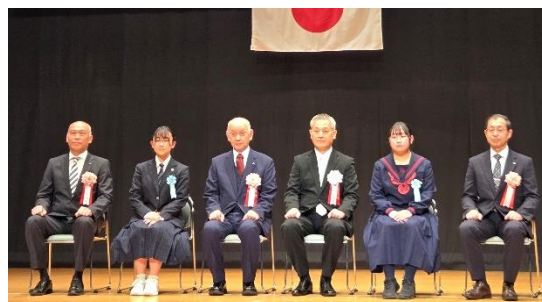
納税表彰式の様子