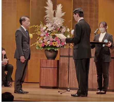
清水様受賞のご様子