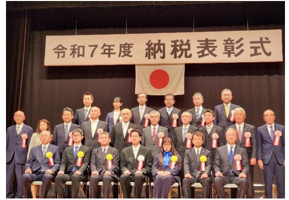
松戸税務署長表彰受賞の皆様