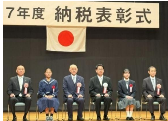
納税表彰式の様子