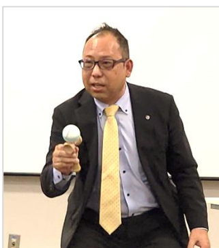
古内税理士講演の様子