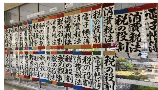
松戸市役所展示作品