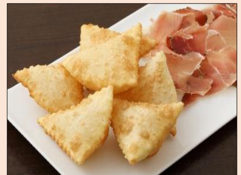
生ハムと一緒にいただく揚げパン