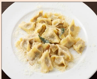
アンニョロッティ ダル プリン

家に帰ってくるつもりで、または、友達の家に行く感覚で気軽に足を運んでもらえたら嬉しいとおっしゃっていました。