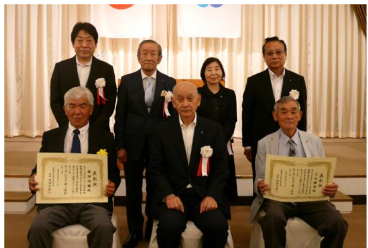
令和6年度 会功労者表彰の皆様